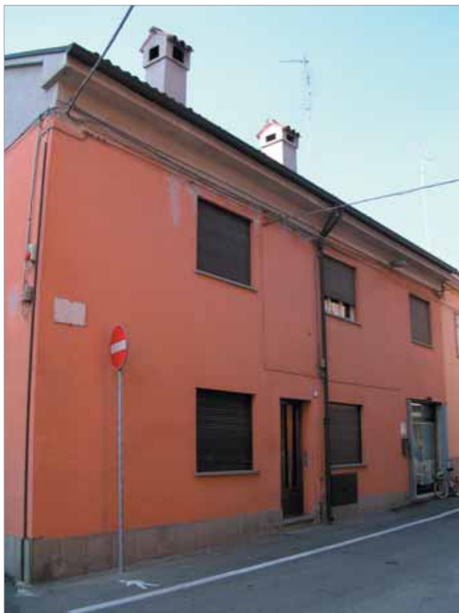
Via Fiume 14; 16 Fronte Principale